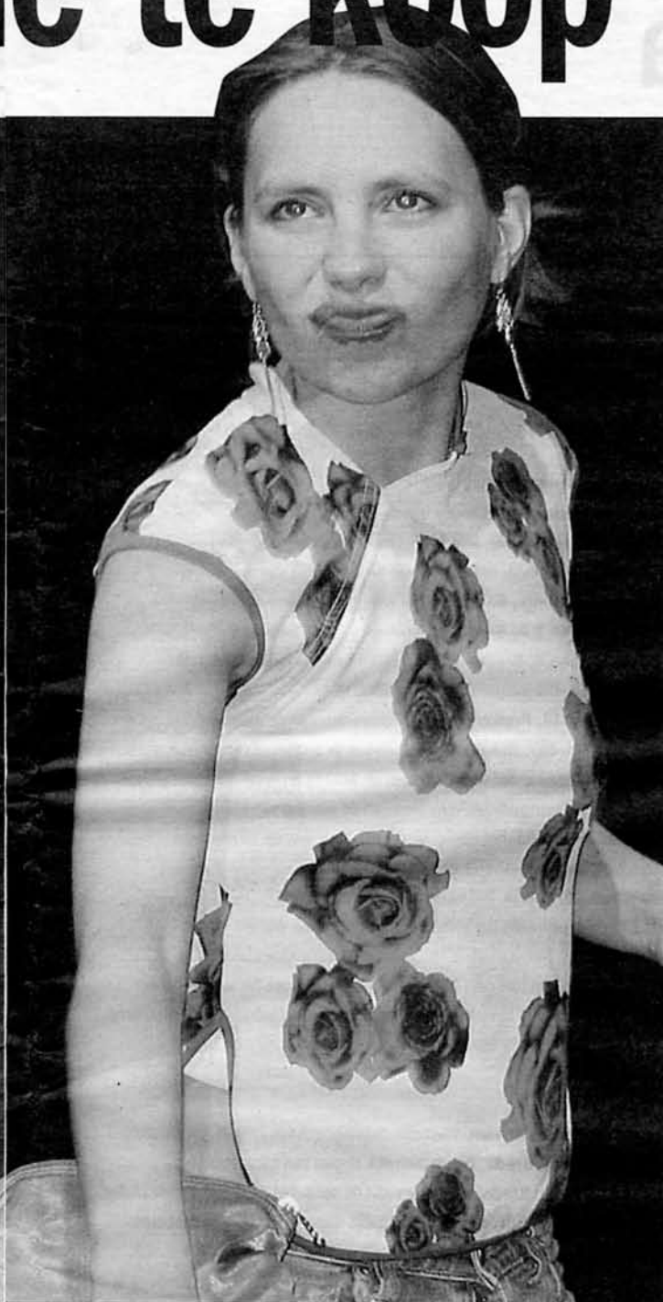
'Liefde te koop' is inmiddels al weer de derde productie van PlayBack. Daarnaast speelt de theatergroep op scholen ook nog steeds de voorstellingen 'HIT' (zie foto) en 'Lef!'.

BREDA - Bij PodiumBloos aan de Speelhuuslaan gaat op dinsdagavond 30 januari nieuwe voorstelling 'Liefde te koop' van theatergroep PlayBack in première